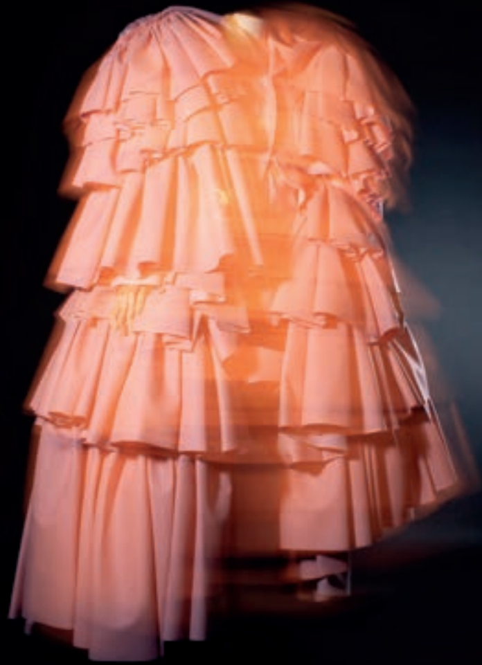
Poederroze ensemble van Rei Kawakubo voor Comme des Garçons, herfst-winter 2016—17