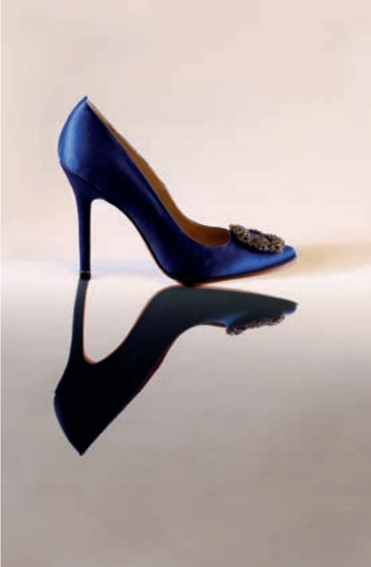
'Hangisi' schoen van Manolo Blahnik, 2008