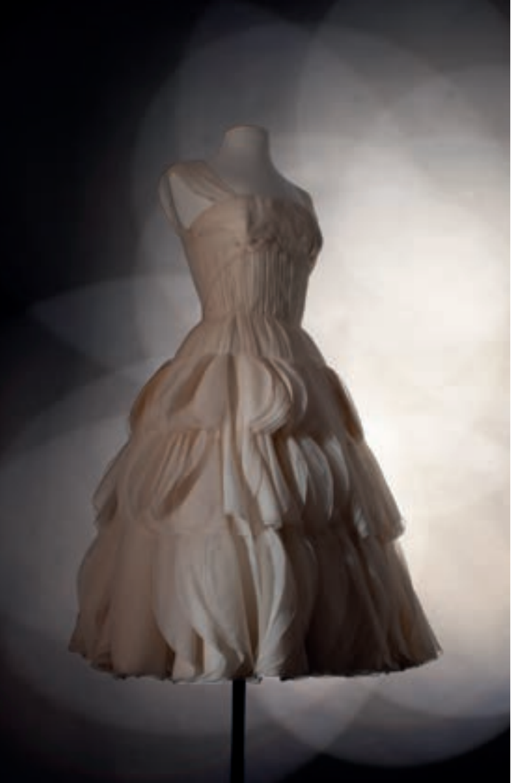
Zijden cocktailjurk van Jean Dessès, lente-zomer 1956