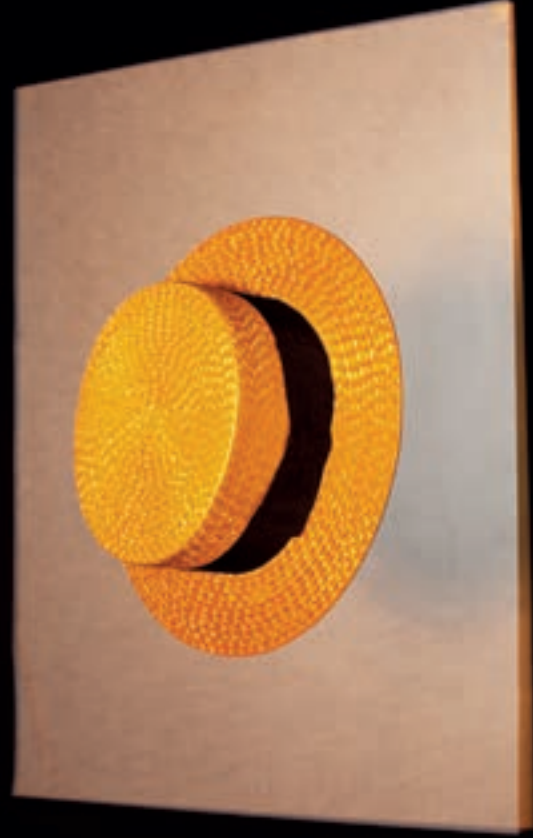
Matelot in natuurkleurige stro, ca. 1925—1935