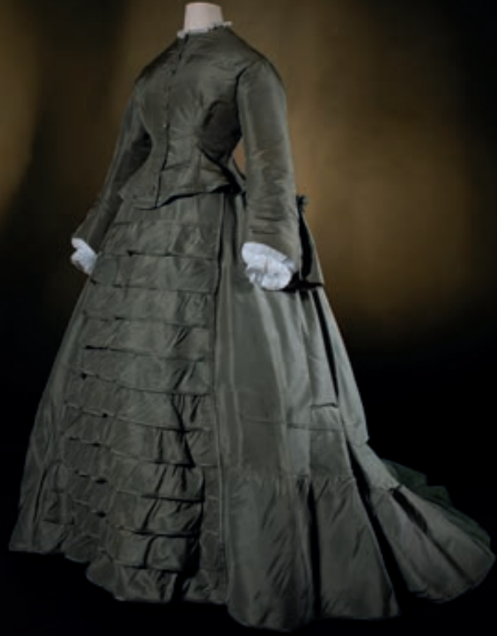
Watergroen zijden ensemble, ca. 1860