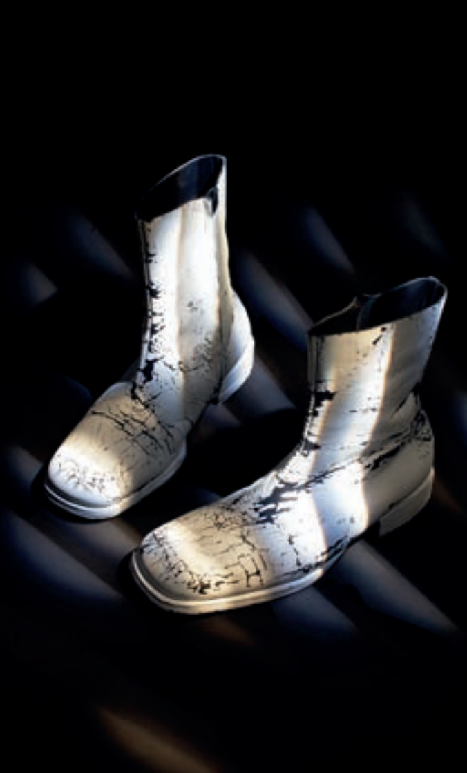
Wit beschilderde leren laarzen van Martin Margiela voor Maison Martin Margiela, ca. 1999—2001