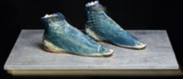
Blauwe leren enkellaarzen, ca. 1830—1840