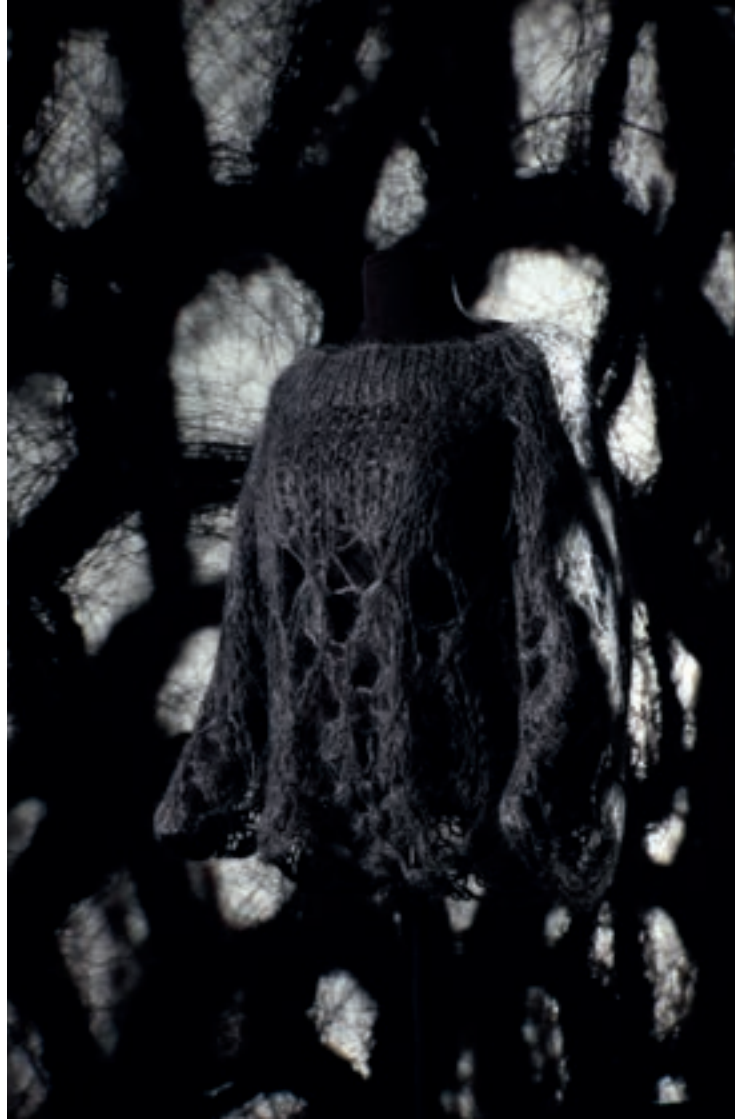
Grijze wollen trui van Martin Margiela voor Maison Margiela, herfst-winter 1990—91