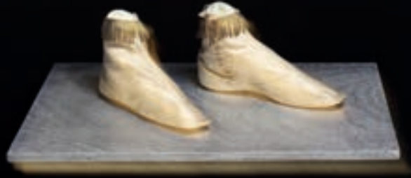
Ecruleurige zijden enkellaarzen, ca. 1830—1840